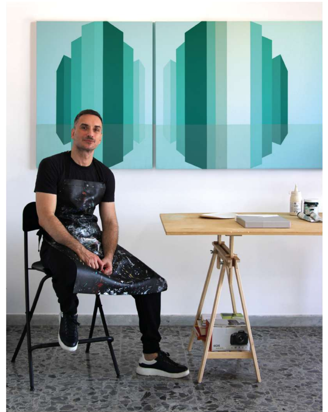
Ha Long Bay (diptych), 2021 acrylic painting on canvas 39.4 x 78.7 in - 100 x 200 cm

Giorgio Pasqualetti è nato il 16 Novembre 1975 a Roma dove ha frequentato l'Istituto Romano di Arti Grafiche. Attivo artisticamente soprattutto dal periodo catalano quando, nel 2013, la pittura è diventata una presenza costante e fondamentale nella sua vita. Entusiasmato dal tessuto multiculturale di Barcellona, ha trovato la fonte di ispirazione che alimenta il suo stile pittorico e che combina l'affascinante cultura catalana con l'elegante stile italiano. Pasqualetti ha attirato l'attenzione di importanti curatori e collezionisti italiani e ha ricevuto la copertura della stampa internazionale su Vogue Italia, Vanity Fair e GQ come artista da osservare. Nell'autunno 2019, l'artista ha fatto il suo debutto a New York City. Giorgio Pasqualetti vive attualmente tra Barcellona, Milano e Roma ed è rappresentato dalla Space SBH Gallery di New York, St. Barth e Montecarlo.