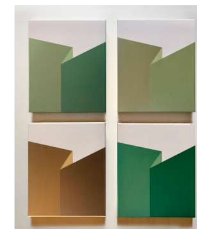
Elizalde, 2020 acrylic on canvas 23.62 x 19.84 in - 60 h x 50 cm