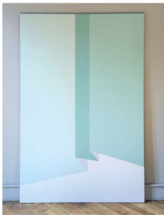
Paseo, 2019, acrylic painting on canvas 195 x 130 cm / 76.8"x51.2"

Alessandro Romito "racconta" il pittore Giorgio Pasqualetti.