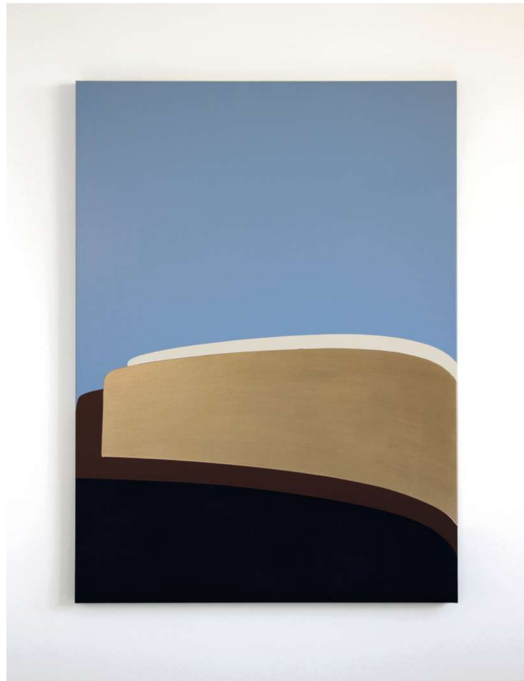
Table Mountain, 2021 acrylic painting on canvas 39.4 x 28.7 in - 100 x 73 cm

La luce dunque, insieme al colore, sono gli elementi caratterizzanti della pittura di Giorgio P. due elementi che l'artista non separa mai ma che, al contrario, unisce e fonde in un unico solido tridimensionale senza peso specifico. Una luce colorata che rimanda alle atmosfere assolate dell'amata Spagna, luogo di formazione artistica del pittore. La Spagna delle architetture fluide e colorate di Antoni Gaudì. La Spagna di Pablo Picasso e delle sue arene immortalate nella luce più calda del giorno.